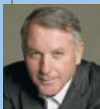
Δημήτρης Β. Νανόπουλος

Ομότιμος και επίτιμος καθηγητής Γλωσσολογίας και τ. Πρύτανης, Πανεπιστήμιο Αθηνών