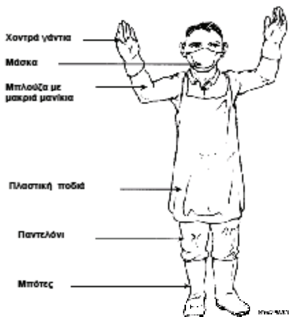
Σχήμα 5: Συνιστώμενη ενδυμασία κατά τη μεταφορά ΕΑΥΜ

Παρακάτω παρουσιάζεται η συνιστώμενη ενδυμασία κατά τη μεταφορά ΕΑΥΜ.