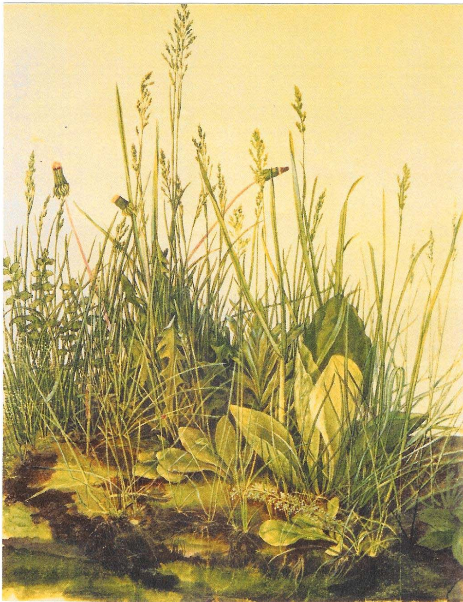
Άλμπρεχτ Ντύρερ «Μεγάλο Κομμάτι χορταριασμένη γη» 1503

Υδατογραφία πενάκι και μελάνι, μολύβι και αραιωμένο χρώμα πάνω σε χαρτί, 40,3 × 31,1 εκ. Άλμπερτίνα, Βιέννη